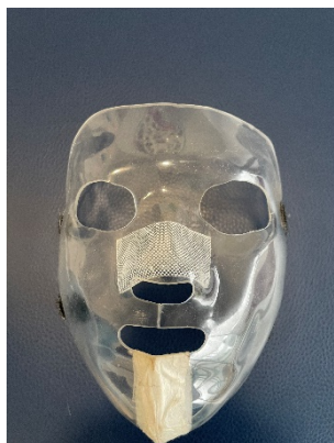
Figura 1. máscara transparente

Las secuelas físicas con las que comúnmente se relacionan las quemaduras faciales son: retracciones, deformidades, cicatrices hipertróficas y queloides. Estas últimas, corresponden a un trastorno de carácter proliferativo que se produce a consecuencia de la pérdida de control de los mecanismos que regulan el balance en la reparación y regeneración tisular (7) .