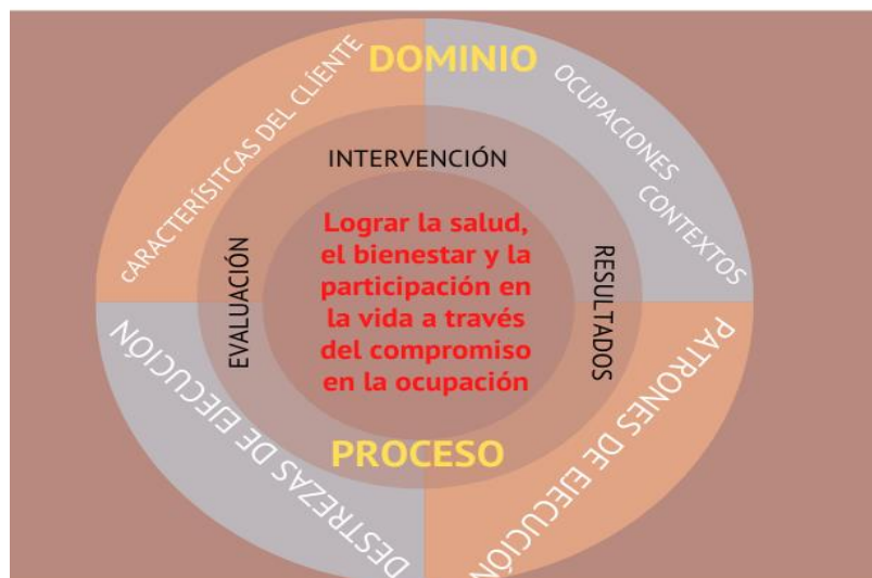
Figura 2. Descripción visual simplificada del dominio y el proceso de la terapia ocupacional. Reeditación propia.

Aunque el dominio y el proceso se describen por separado, en realidad están unidos de modo indisoluble en una relación transaccional.