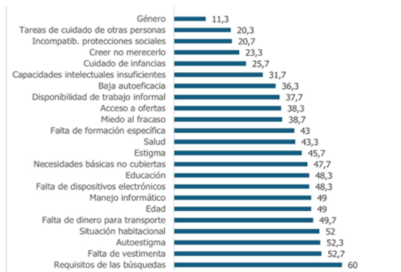
Figura 2. Barreras autopercibidas para el acceso al trabajo de PSC Nota: Elaboración propia 2024