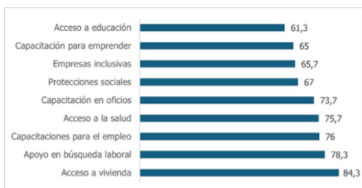
Figura 3. Apoyos para buscar trabajo Nota: Elaboración propia 2024